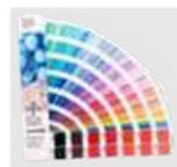
Couleur RAL sur commande